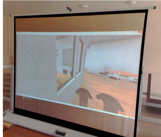
■ Den virtuella världen projiceras på duk.