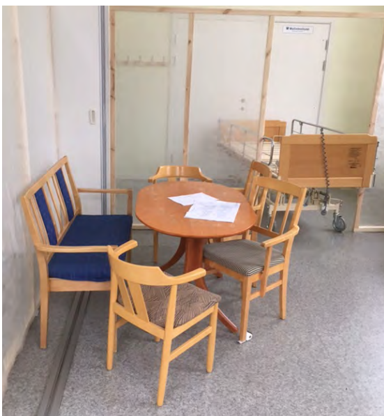
■ Uppbyggnad av provlägenhet inför ombyggnation.

I arbetet med att ta fram en bra planlösning och utformning av ett boenderum har en provlägenhet i skala 1:1 byggts upp. Lägenheten byggdes upp enligt de förutsättningar som fanns för att bygga om befintliga lägenheter på Söderåsens äldreboende. Vid genomgång av provlägenhetens förutsättningar med personal, chefer och politiker konstaterades att utformningen inte skulle stödja den boendes behov och personalens arbetsmiljö.