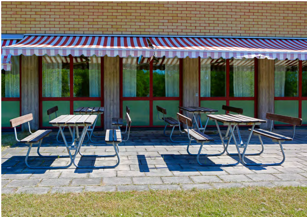
■ Uteplats på Bäckaskog.

Kopplingsnoder för datanätet ska i största möjliga mån placeras i avskilt utrymme till vilket endast behörig personal ges tillträde. Detta ska styras av ett centralt passagesystem och de som beträder utrymmet ska loggas.