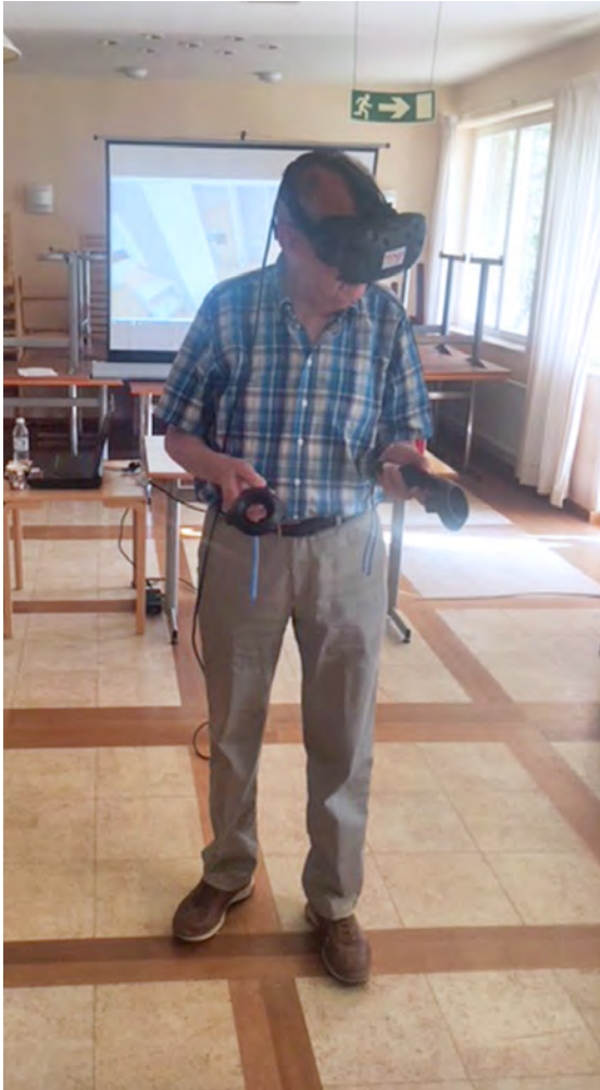
■ Boendet upplevs med hjälp av VR-glasögon i den virtuella miljön.