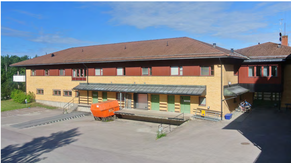
■ Bäckaskog baksida.

Hantering av sopor och avfall tar mycket tid i anspråk på ett äldreboende. Tekniska lösningar som underlättar transporter och minskar personalens tid med hanteringen ska eftersträvas. Det kan vara till exempel centralt placerad sopsug som transporterar bort avfallet. Anpassade lösningar för hantering av avfall ska finnas på eller i direkt anslutning till respektive avdelning. De fraktioner som det ska finnas plats för är enligt kommunens avfallsplan och efter de behov som finns inom äldreboendet. De soprum som iordningställs behöver kyla för att hålla nere temperaturerna och därmed motverka lukt.