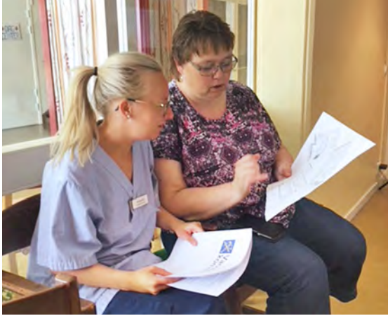
■ Personal går igenom ritningar på det planerade boendet.