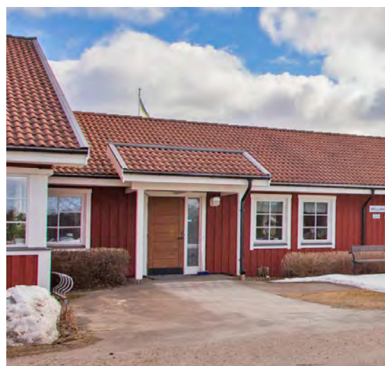
■ Bergheden, Äppelbo.