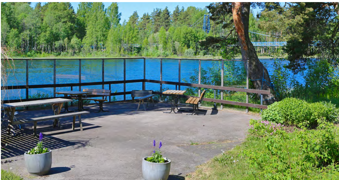
■ Naturskön uteplats med glasat räcke vid Bäckaskogs äldreboende med utsikt ut över Vanån.

Balkonger/terrasser ska tillgodose möjlighet till dagsljus och frisk luft. Vistelse på balkonger/terrasser ska ske under trygga förhållanden. Balkonger/terrasser ska vara stora och rymliga, möjlighet att vistas ute i säng ska finnas. Golvet ska vara lättskött, det ska vara breda dörrar och möjlighet till infravärme. Utesäsongen ska kunna förlängas genom inglasning som är öppningsbar. Möbleringen ska vara lätt att flytta omkring och sittriktiga möbler är av vikt, bord ska kunna fällas ihop och dras ut. Det ska finnas plats för odlingslådor/blomlådor. Det ska gå att avskärma mot för starkt solljus till exempel med markis eller gardin.