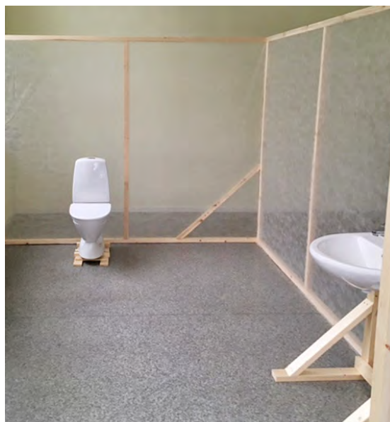
■ En modell av badrum byggdes upp för att åskådliggöra olika lösningar.